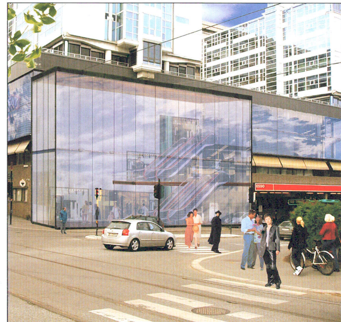
GLASS OG STÅL: Vika Torvet hadde problemer med at forbigående ikke så at bygget faktisk huset et kjøpesenter. Nå blir fasadene pusset opp slik at det ikke lenger er tvil om hva som ligger bak glasset.

House of Oslo er utviklet av Storebrand og Aberdeen Property Investors. Senteret vil strekke seg over 14 000 kvadratmeter, fordelt på fire etasjer. Molander forteller at de også forventer en kraftig økning i omsetning, opp mot 500 millioner kroner. Dette målet skal nås i løpet av noen år.